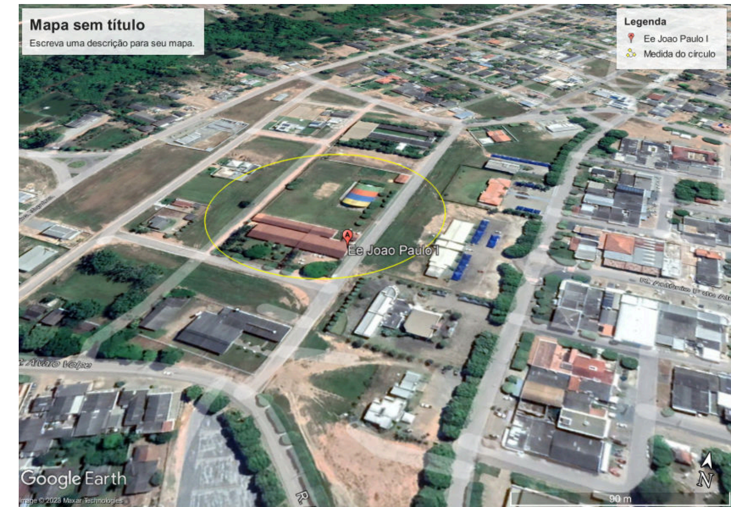
LOCALIZAÇÃO E.E JOÃO PAULO I (À DEMOLIR)